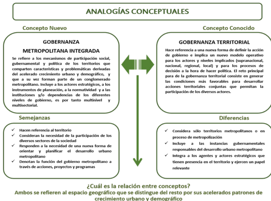
FIGURA 2 Gobernanza Metropolitana Integrada