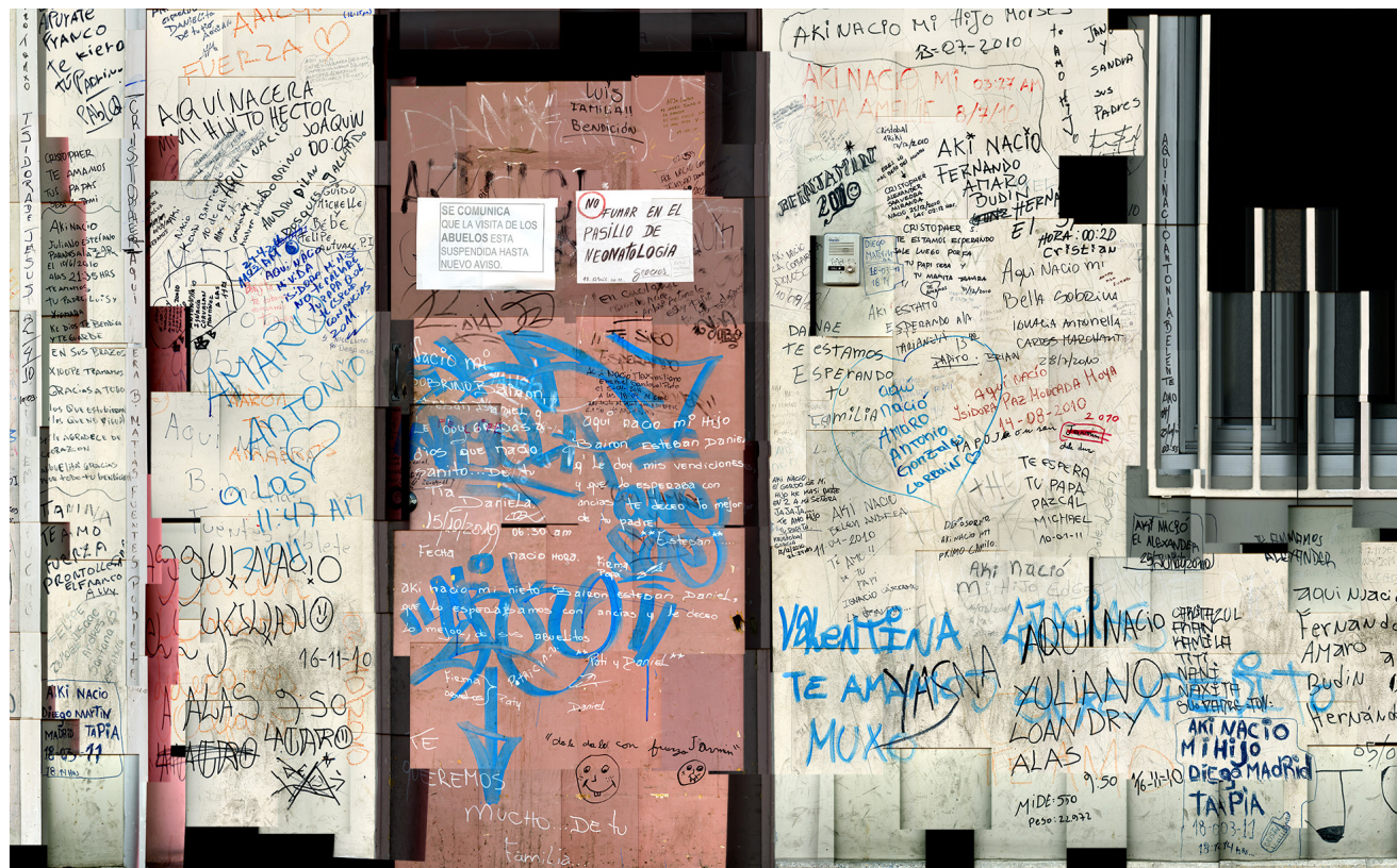
ESCANOGRAFÍA HOSPITAL BARROS LUCO / AÑO 2010

GRUPO DE AMIGAS ADULTAS MAYORES, LA REINA.