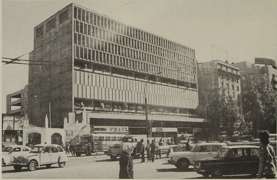
Edificio de Estacionamientos Copacabana. Arquitectos Bolton, Larraín, Prieto y Lorca.