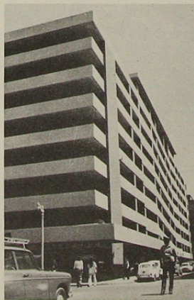
Edificio de Estacionamientos Moneda. Arquitectos Eduardo Cuevas, Carlos Neira y Carlos Silva.