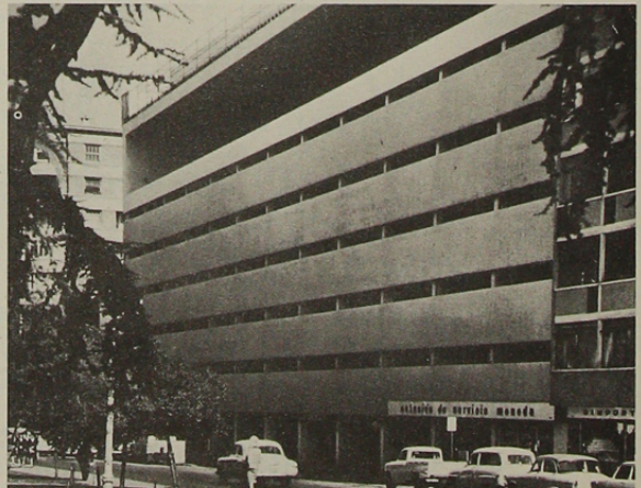
Edificio de Estacionamientos Impala. Arquitecto Santiago Roi.