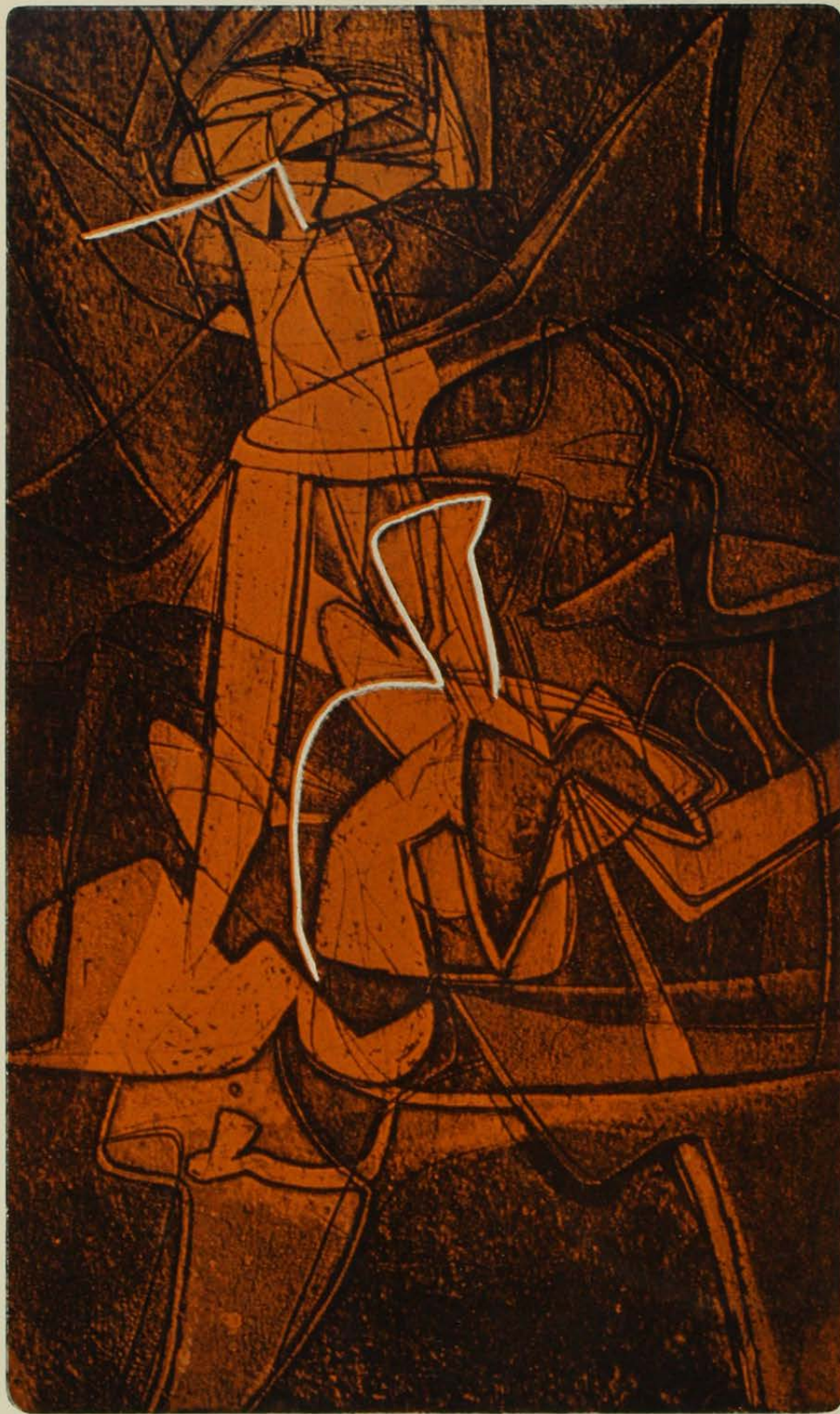
Nacimiento de Icaro.