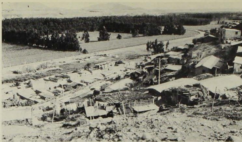
La ciudad de Ovalle se encuentra ubicada entre el río Limarí y una meseta separada por una ladera de violenta pendiente.