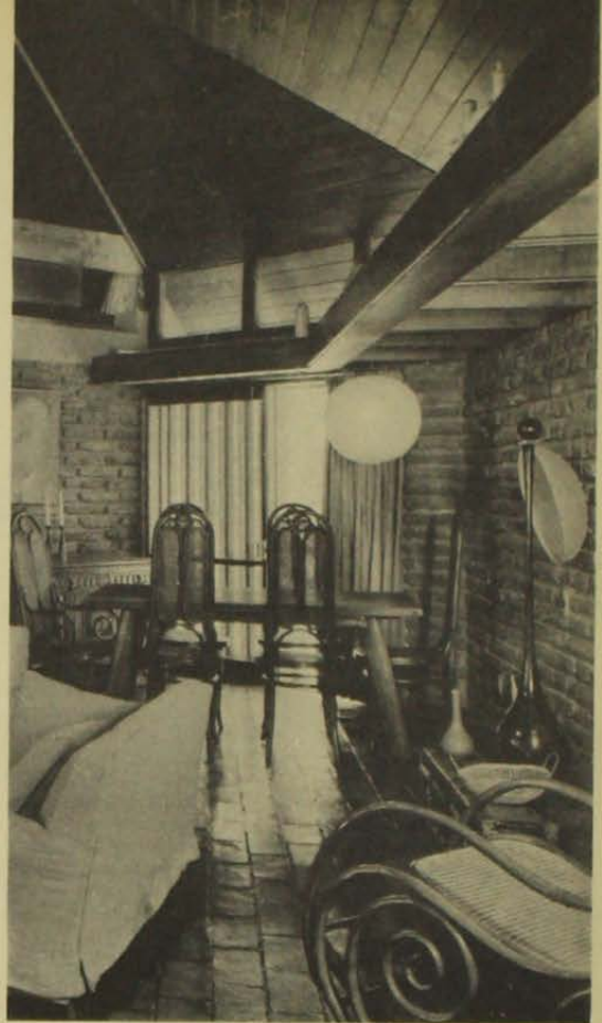
En un rincón del estar se aloja la mesa de comer. Al fondo, un panel deslizante proyecta la vista hacia el oriente.